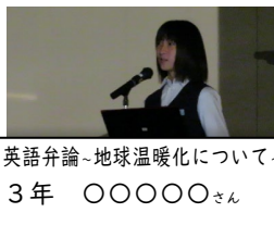
英語弁論-地球温暖化について- 3年 ○○○○さん