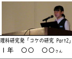
理科研究発「コケの研究 Part2」 1年 ○○ ○○さん