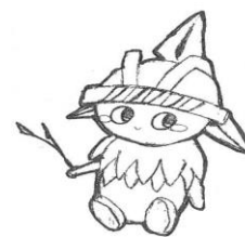
都幾中マスコット「とき丸」